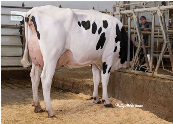
PROGENESIS TOPNOTCH MACIE GRANDDAM