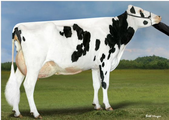
PROGENESIS DUKE MELEE THIRD DAM